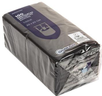
Image du paquet

Règlement (CE) n° 2023/2006 de la Commission du 22 décembre 2006 relatif aux bonnes pratiques de fabrication des matériaux et objets destinés à entrer en contact avec des denrées alimentaires.