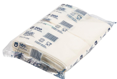
Image du paquet

104.03 DISTRIBUTEUR POUR SERVIETTES MINI SERVIS 129.32 DISTRIBUTEUR POUR 300 SERVIETTES MINI SERVIS 129.34 DISTRIBUTEUR SERVIETTES MINI SERVIS 129.35 DISTRIBUTEUR SERVIETTES MINI SERVIS 231.29 DISTRIBUTEUR SERVIETTES MINI SERVIS