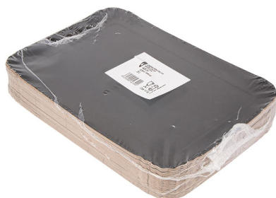
Image du paquet

229.88 BOÎTES CATERING MICROCANNELEURE, PLATE 229.93 BOÎTES CATERING AUTOMONTABLE